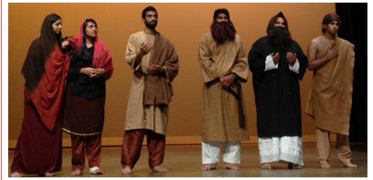
Interactive wax museum: a scene from the Leadership Camp

The 12 th Annual Leadership Camp was successfully held at Alma College, MI, from July 25-28, 2012. The theme was "Alter Your Perception", based on St. Luke 17:21. Nearly 150 registered delegates, clergy and seminarians from both the Northeast American Diocese and the Diocese of South-West America of the Malankara Orthodox Syrian Church attended Leadership Camp Detroit (LCD) 2012.