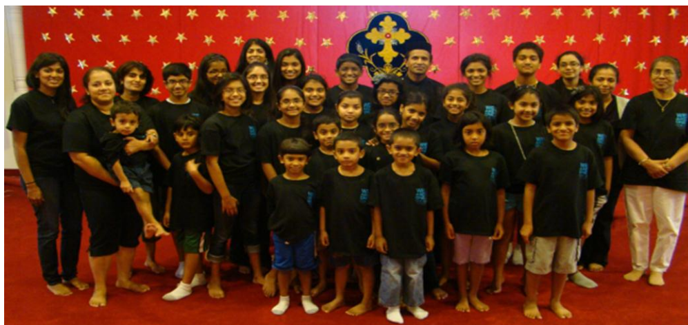
OVBS held at St. Mary's Orthodox Church, St. Louis from August 2 nd through August 4 th

Oklahoma: The 8 th Annual Southern Regional Orthodox Sports Tournament was conducted at the University of Oklahoma on August 10 th and August 11 th . Teams from the parishes in Texas and Oklahoma participated in the volleyball and basketball tournament. This year's tournament was hosted by St. Thomas Orthodox Church Oklahoma MGOCSM.